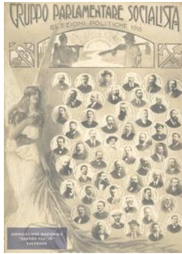
Groupe parlementaire socialiste aux élections de 1913 carte postale

parfois contradictoires, qui tendent tous à chercher à gouverner le marché du travail, à s'opposer à ses « lois » économiques.