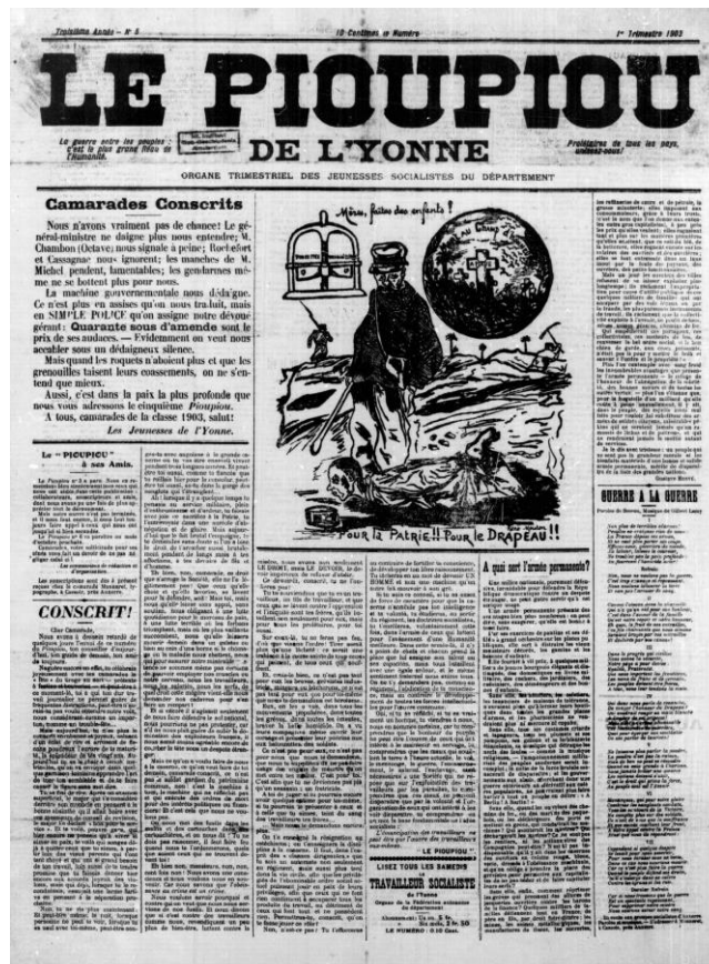
Une du trimestriel Le Piou Piou de l'Yonne, Organe trimestriel des jeunesses socialistes du département. 1er Trimestre 1903.